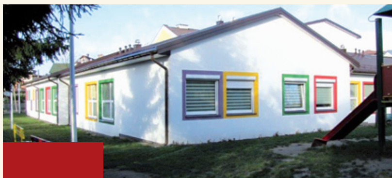
Przedszkole w Księżynie / Przedszkole w Kleosinie