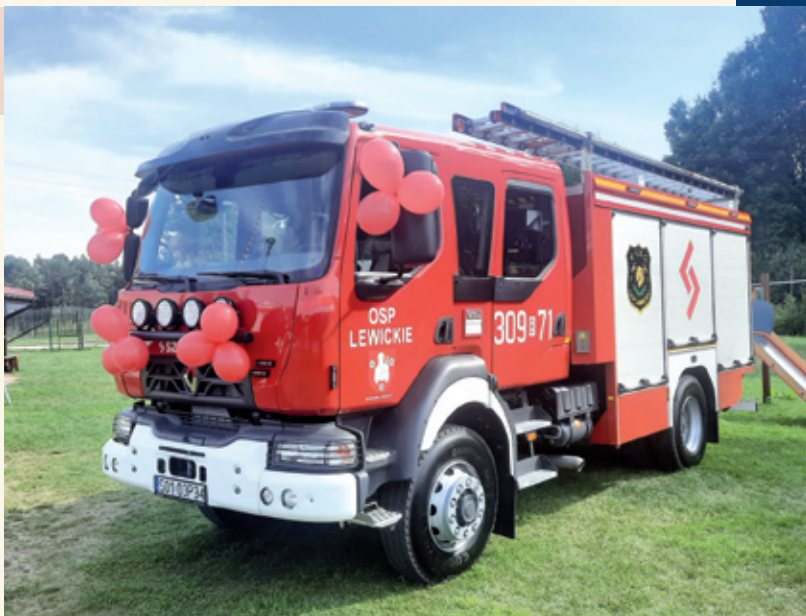
Samochód strażacki Jednostki OSP Lewickie

► zakup sprzętu komputerowego na potrzeby urzędu gminy, 2022,