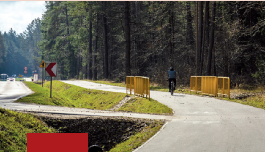
Hryniewiczze, ścieżka rowerowa