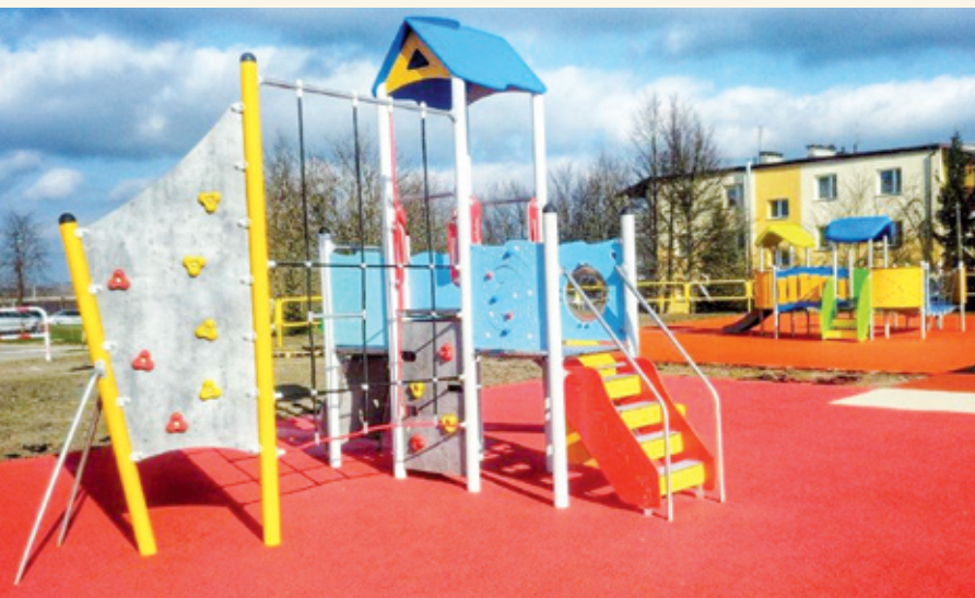
Plac zabaw w Juchnowcu Górnym

Gmina Juchnowiec Kościelny w mijającej kadencji na inwestycje służące rekreacji i uprawianiu sportu wydała łącznie 2 814 699 zł