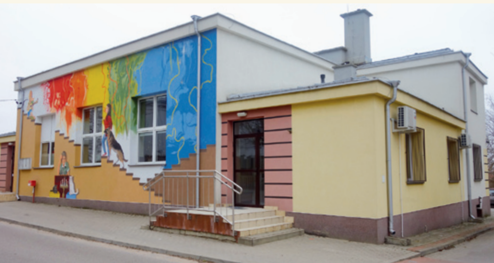
Siedziba ośrodka kultury i biblioteki gminnej w Juchnowcu Kościelnym