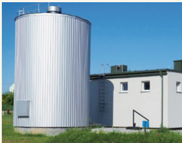
Stacja uzdatniania wody w Juchnowcu Kościelnym

Budżet gminy Juchnowiec Kościelny z roku na rok jest w coraz lepszej kondycji. Pozwala na realizację wielu potrzebnych inwestycji, co z kolei skutkuje wyższą jakością usług i sprawia, że gmina Juchnowiec Kościelny jest coraz lepszym miejscem do życia, a także staje się atrakcyjniejsza dla inwestorów.