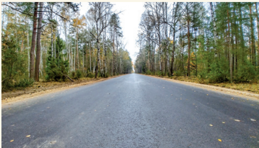
Droga Hołówki Małe – Hołówki Duże

Gmina Juchnowiec Kościelny w mijającej kadencji wydała łącznie na drogi 35 317 386 zł